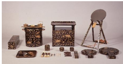
4 菊唐草蒔絵化粧道具 江戸時代後期 永青文庫蔵