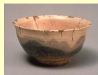
熊川茶碗 銘 夏山 朝鮮時代(16~17世紀)