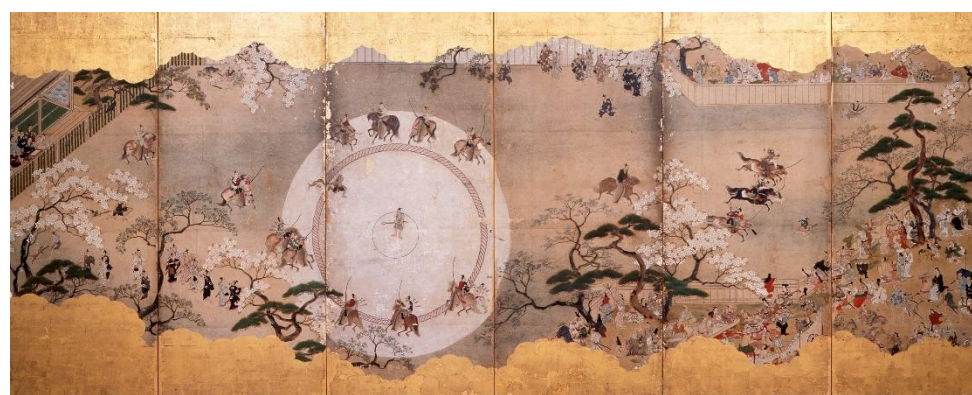
犬追物図屏風 江戸時代前期 永青文庫蔵(熊本県立美術館寄託) ※展示替えあり【展示期間 右隻:7/21~8/26、左隻:8/28~10/3】