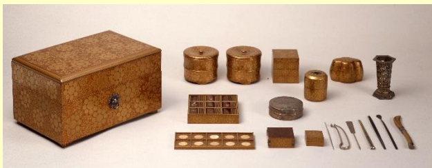
九曜紋唐草詩絵十種香道具 江戸時代後期