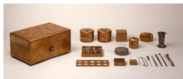
6 九曜紋唐草蒔絵十種香道具 江戸時代後期 永青文庫蔵