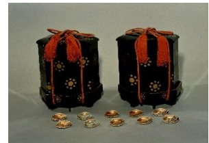
5 九曜紋蒔絵貝桶 江戸時代後期 永青文庫蔵