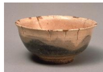
7 熊川茶碗 銘 夏山 朝鮮時代(16～17世紀) 永青文庫蔵