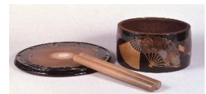
8 扇面散蒔絵太鼓胴 江戸時代前期 永青文庫蔵