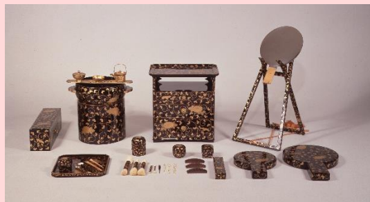
菊唐草詩絵化粧道具 江戸時代後期

大名家では嫁入りの際に、身の回りの生活道具一式を持参する習わしがあったため、細川家伝来の調度品のなかには、他家から嫁いだ姫君の婚礼道具が複数含まれています。なかでも菊唐草模様や詩絵があしらわれた化粧道具は揃いの調度として貴重です。