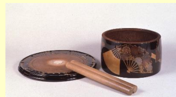
扇面散詩絵太鼓胴 江戸時代前期