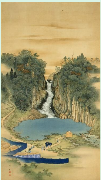
杉谷雪樵 七滝御覧図 江戸時代後期