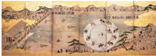
2 犬追物図屏風 江戸時代前期 永青文庫蔵(熊本県立美術館寄託) 【展示期間 右隻:7/21～8/26、左隻:8/28～10/3】