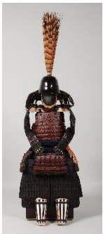
1 栗色革包紺糸射向紅威二枚胴具足 (十二代細川斉護所用) 江戸時代後期 永青文庫蔵(熊本県立美術館寄託)