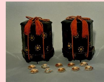
九曜紋詩絵貝桶 江戸時代後期