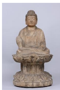
3 重要文化財 「如来坐像」 中国 唐時代(7世紀後半) 永青文庫蔵