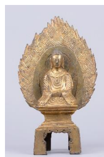
7 重要文化財 「如来坐像」 中国 宋時代 元嘉14年(437年) 永青文庫蔵