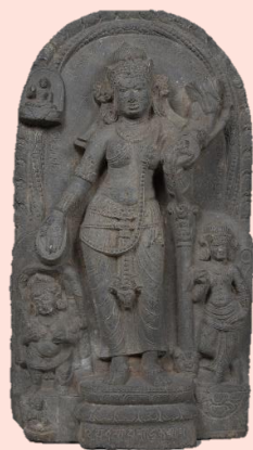
「ターラー菩薩立像」 インド パーラ時代(9～10世紀) 永青文庫蔵(熊本県立美術館保管)

永青文庫には、インドの石彫が20点以上伝わりますが、これまでほとんど展示されることはありませんでした。今回の調査で、この知られざるコレクションの全容が明らかとなり、本展では、8～12世紀のインド彫刻約10点を紹介します。