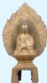
重要文化財「如来坐像」 中国 宋時代 元嘉14年(437年) 永青文庫蔵