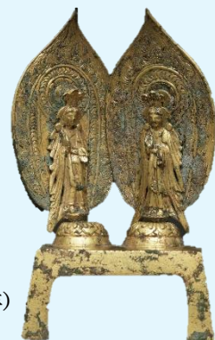
「双観音菩薩立像」 中国 北齊時代 天保8年(557年) 個人蔵