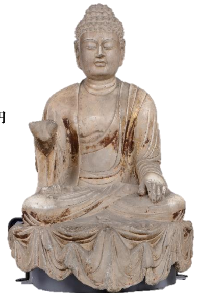
重要文化財「如来坐像」 中国 唐時代(8世紀前半) 永青文庫蔵

申込方法 1月19日(土)午前10:00より電話(03-3941-0850)にて先着順に受付