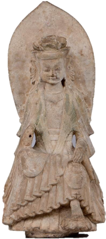
重要文化財「菩薩半跏思惟像」 中国 北魏時代(6世紀前半) 永青文庫蔵