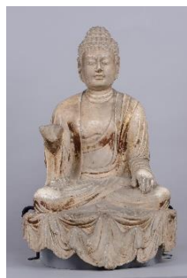
2 重要文化財 「如来坐像」 中国 唐時代(8世紀前半) 永青文庫蔵