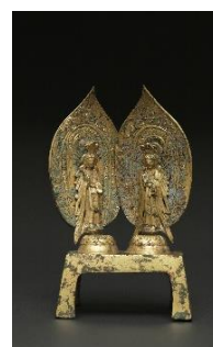
8 重要文化財 「双観音菩薩立像」 中国 北齊時代 天保8年(557年) 個人蔵