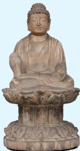
「如来坐像」 中国 唐時代(7世紀後半) 永青文庫蔵