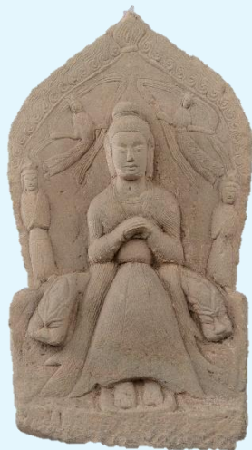
「道教三尊像」 中国 北魏時代 永平年間(508～511年) 永青文庫蔵

永青文庫の東洋彫刻コレクションが一堂に会する初めての展覧会。専門家の協力を得て行った調査をもとに、重要文化財3点を含む選りすぐりの作品、個人蔵の貴重な金銅仏あわせて約40点を紹介します。