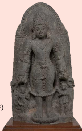
「ヴィシュヌ立像」 インド ポスト・グプタ時代(7～8世紀) 永青文庫蔵(熊本県立美術館保管)