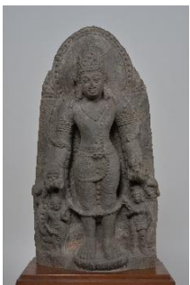
5 重要文化財 「ヴィシュヌ立像」 インド ポスト・グプタ時代(7～8世紀) 永青文庫蔵(熊本県立美術館保管)