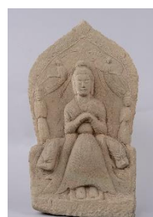
4 重要文化財 「道教三尊像」 中国 北魏時代 永平年間(508～511年) 永青文庫蔵