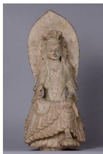
1 重要文化財 「菩薩半跏思惟像」 中国 北魏時代(6世紀前半) 永青文庫蔵