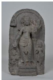
6 重要文化財 「ターラー菩薩立像」 インド パーラ時代(9～10世紀) 永青文庫蔵(熊本県立美術館保管)