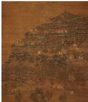
1 顧氏「咸陽宮(樓閣)図」(明時代15世紀、前期展示、永青文庫蔵)