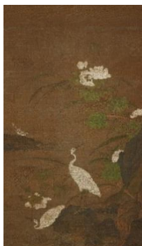
4 (伝)呂健「芙蓉鷺図」(明時代16世紀、後期展示、永青文庫蔵)