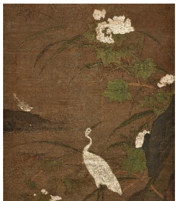
(伝)呂健「芙蓉鷺図」(明時代16世紀、部分、後期展示)