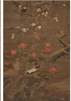
3 呂紀(款)「花鳥図」(明時代16世紀、後期展示、永青文庫蔵)