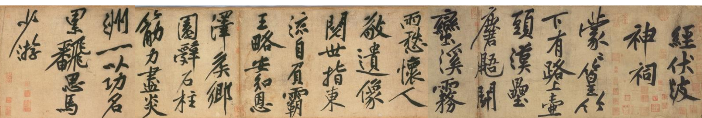
特別展示 黄庭堅「伏波神祠詩卷」(重要文化財、宋時代・建中靖国元年(1101)、部分、前期展示)

黄庭堅(1045~1105)は、詩文と書に秀で、書は蘇軾・米芾・蔡襄とともに宋の四大家に数えられます。「伏波神祠詩卷」は黄庭堅晩年期における行書の代表作として知られています。