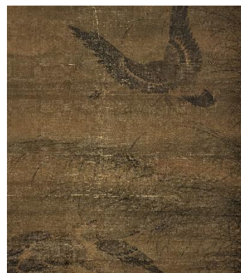
汪肇「月雁図」(明時代16世紀、部分、後期展示)