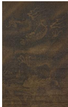
2 (伝)劉祥「雲龍圖」(明時代16世紀、前期展示、永青文庫蔵)