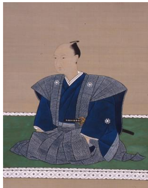
「細川斉茲像」(江戸時代19世紀、部分、通期展示)

本展では、斉茲の生誕260年に合わせ、永青文庫所蔵の中国絵画を展示します。江戸時代後期の大名家が求めた大幅の「唐絵」の数々をご覧ください。