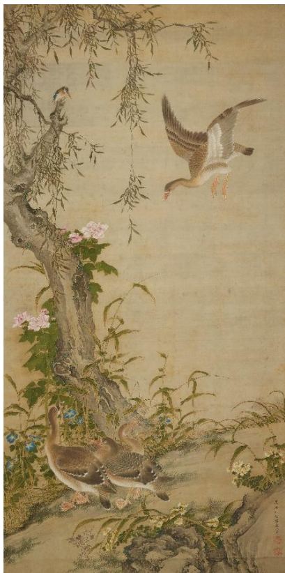
沈南蘋「芦雁図」(清時代18世紀、通期展示)