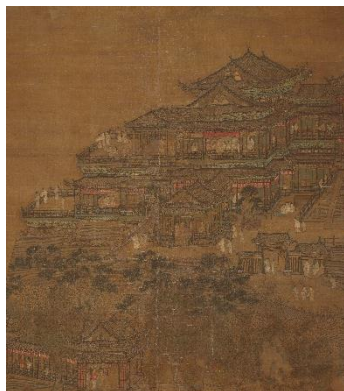
顧氏「咸陽宮(樓閣)図」(明時代15世紀、部分、前期展示)