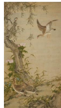
6 沈南蘋「芦雁図」(清時代18世紀、通期展示、永青文庫蔵)