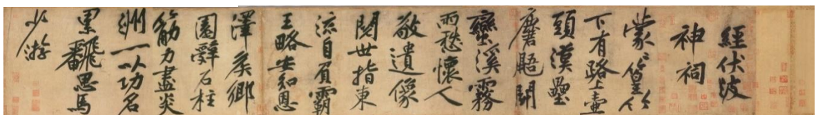
7 黄庭堅「伏波神祠詩卷」(宋時代・建中靖国元年(1101)、重要文化財、永青文庫蔵、部分、前期展示)