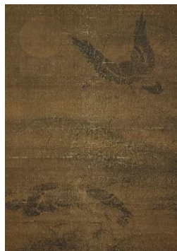
5 汪肇「月雁図」(明時代16世紀、後期展示、永青文庫蔵)