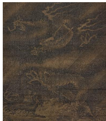
(伝)劉祥「雲龍図」(明時代16世紀、部分、前期展示)