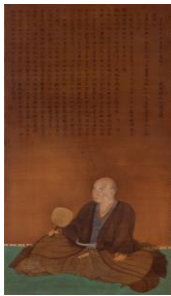
1 「細川幽斎(藤孝)像」 江戸時代(18世紀)、永青文庫蔵