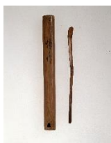
千利休作「茶杓 銘 ゆがみ」 桃山時代(16世紀) 永青文庫蔵