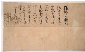
3 重要文化財「織田信長黒印状」 天正5年(1577)3月15日 永青文庫蔵(熊本大学附属図書館寄託)