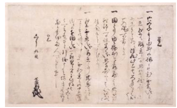
4 重要文化財「明智光秀覚条々」 天正10年(1582)6月9日、永青文庫蔵 4/25～5/14期間限定展示