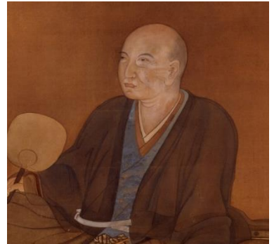
「細川幽斎(藤孝)像」(部分) 江戸時代(18世紀) 永青文庫蔵

細川家初代・藤孝と光秀は、信長の指示のもと、連携しながら畿内近国で繰り広げられた一向一揆の矢面にたち、死闘を続けました。さらに、藤孝は領地・丹後において、検地の進め方や家臣団の統制など、光秀の全面的な関与のもとに、支配体制を構築していきました。その様子を、数多くの信長の書状からご紹介します。