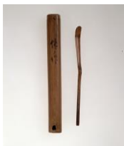
8 千利休作「茶杓 銘 ゆがみ」 桃山時代(16世紀)、永青文庫蔵