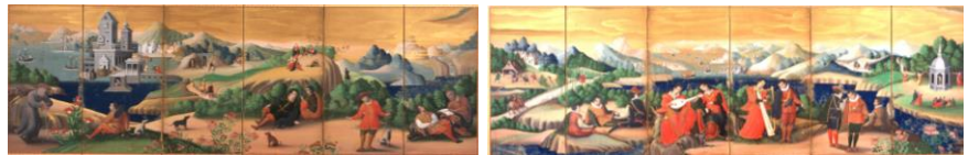
6 重要文化財「洋人奏楽図屏風」 桃山～江戸時代(17世紀)、永青文庫蔵(熊本県立美術館寄託)