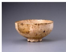
「粉引茶碗 大高麗」 朝鮮時代(15~16世紀) 永青文庫蔵

本能寺の変後、藤孝から細川家の家督を譲られた忠興。忠興は、千利休の高弟としても著名な茶人の顔をあわせもっています。忠興所用の茶道具や刀剣とともに、彼の人物像をご紹介します。「歌仙兼定」は3年ぶりに永青文庫に再登場!