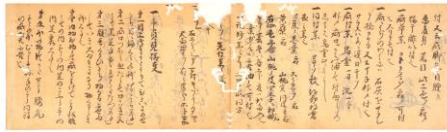
2 「針薬方」米田貞能(求政)書写 室町時代(16世紀)、個人蔵(熊本県立美術館寄託)