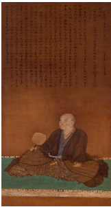
1 「細川幽斎(藤孝)像」 江戸時代(18世紀) 永青文庫蔵