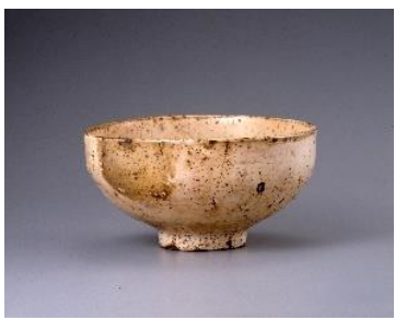
「粉引茶碗 大高麗」 朝鮮時代(15~16世紀) 永青文庫蔵