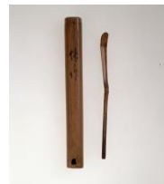
7 千利休作「茶杓 銘 ゆがみ」 桃山時代(16世紀) 永青文庫蔵