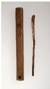
千利休作「茶杓 銘 ゆがみ」 桃山時代(16世紀) 永青文庫蔵

本能寺の変後、藤孝から細川家の家督を譲られた忠興。忠興は、千利休の高弟としても著名な茶人の顔をあわせもっています。忠興ゆかりの茶道具の名品をご紹介します。