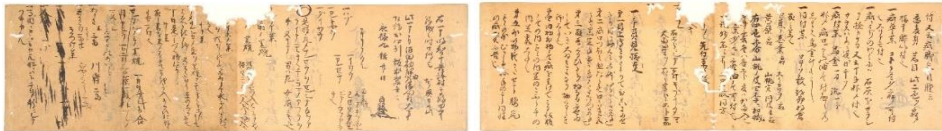
2 「針薬方」米田貞能(求政) 永禄9年(1566)10月書写 個人蔵(熊本県立美術館寄託)