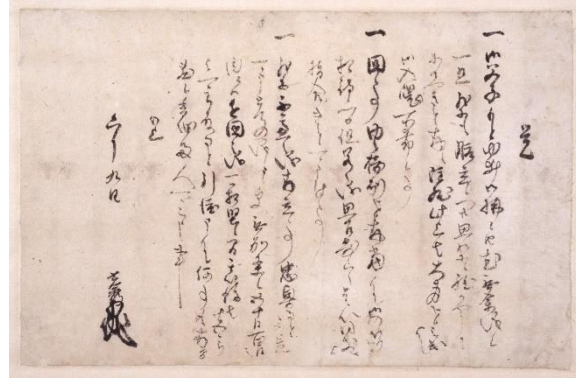
重要文化財「明智光秀覚条々」 細川藤孝・忠興宛 (天正10年<1582>)6月9日 永青文庫蔵

本能寺の変からわずか7日後に、光秀から藤孝・忠興親子に宛てて出された三カ条「明智光秀覚条々」。自分の味方になってくれるよう協力を求めるとともに、今回の謀反は、自分の息子や忠興をはじめとした次世代へ権力を渡すことが目的であったのだ、ということがしたためられています。日本史上最大の謎とされる「本能寺の変」の理由に迫ります。