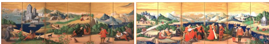
6 重要文化財「洋人奏楽図屏風」 桃山～江戸時代(17世紀) 永青文庫蔵(熊本県立美術館寄託) [展示期間] 右隻: 11月21日～12月27日、左隻: 1月9日～1月31日