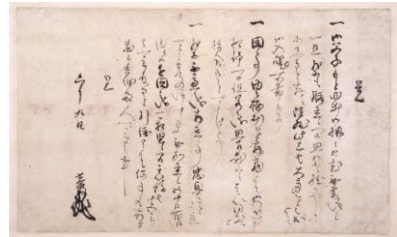
4 重要文化財「明智光秀覚条々」 細川藤孝・忠興宛 (天正10年(1582))6月9日 永青文庫蔵 ※12月22日(火)～2021年1月31日(日)期間限定展示