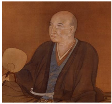
「細川幽斎(藤孝)像」(部分) 江戸時代(18世紀) 永青文庫蔵

細川家初代・藤孝と光秀は、信長の指示のもと、連携しながら畿内近国で繰り広げられた一向一揆の矢面に立ち、死闘を続けました。さらに、藤孝は領地・丹後において、検地の進め方や家臣団の統制など、光秀の全面的な関与のもとに、支配体制を構築していきました。その様子を、数多くの信長の書状からご紹介します。