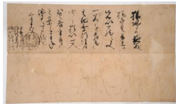
3 重要文化財「織田信長黒印状」 藤孝・長秀・一益・光秀宛 (天正5年(1577))3月15日 永青文庫蔵(熊本大学附属図書館寄託)